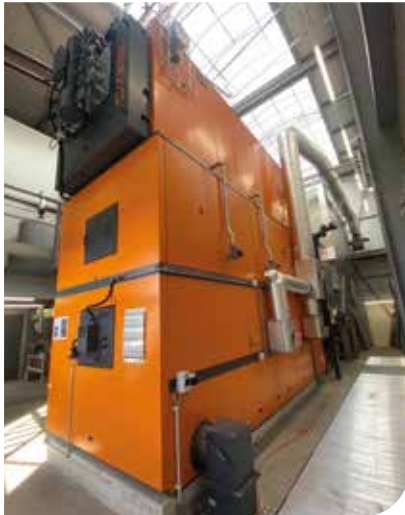
Heizzentrale an der Ifangstrasse