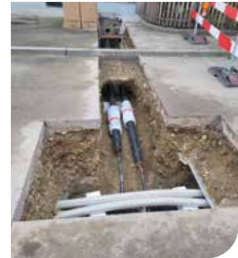
Hausanschluss in der Realisation